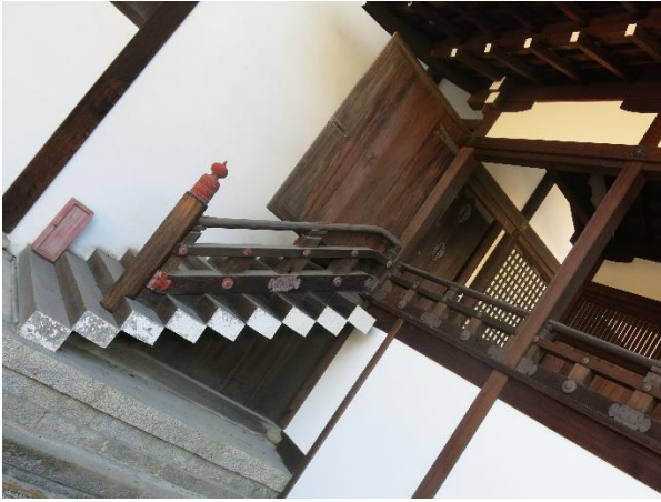
Andreas Schmid: Raum/Fläche – Kyoto 7, Fotografie, 2020